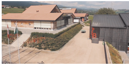
Les écoles (2002-2010) et l'entrée de la piscine couverte (2004).

Ce programme implique que la population, les autorités législatives et exécutives doivent travailler ensemble et être solidaires. Certes les idées peuvent être critiquées mais elles doivent être débattues.