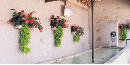
Fontaine de la Tilette changée en 2014.

complète le dispositif ainsi que des accueillantes en milieu familial. Ces services sont importants car ils incitent de nombreuses familles à déménager à Bassins. Ce n'est pas notre éloignement de la ville qui doit nous rendre insensible aux attentes de nos habitants mais il est important de contrôler le phénomène sociodémographique appelé « néo-ruralité ».