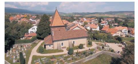
Eglise Notre-Dame de Bassins et le bourg en arrière-plan..

Pour vos messages publicitaires print et digital, une seule adresse !